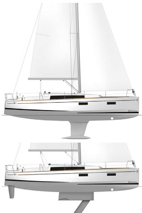
Dériveur - Option : Arceau